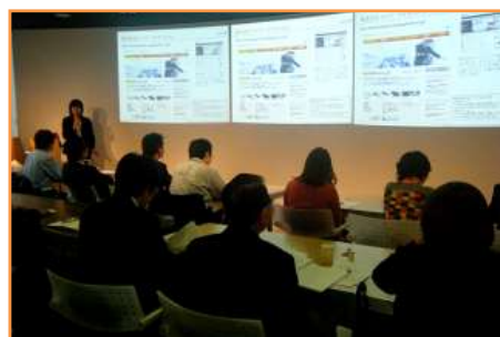
テレワーク・ミニセミナーの様子

ミニセミナーは、1社2名様まで、最大20名を予定しております。 個別コンサルティングは、最大3社を予定しています。 いずれも人数に達し次第締め切らせていただきますのでご了承ください