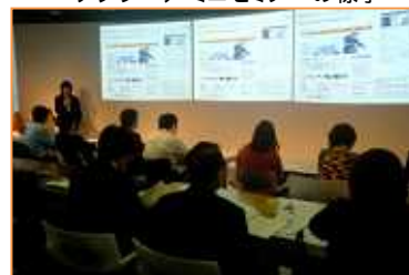
テレワーク・ミニセミナーの様子

遠方の方を対象に、インターネットのライブ中継を予定しています。インターネットでの聴講をご希望の方も、お申し込みをお願いいたします。