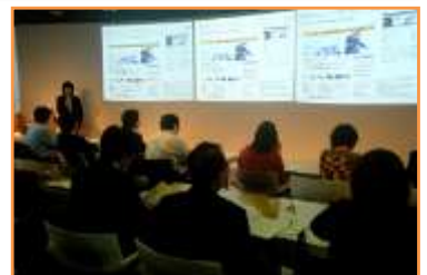
テレワーク・ミニセミナーの様子

遠方の方を対象に、インターネットのライブ中継を予定しています。インターネットでの聴講をご希望の方も、お申し込みをお願いいたします。