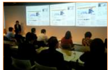
テレワーク・ミニセミナーの様子

遠方の方を対象に、インターネットのライブ中継を予定しています。インターネットでの聴講をご希望の方も、お申し込みをお願いいたします。