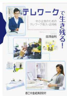
「中小企業のためのテレワーク」